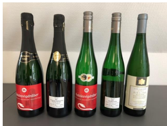
Ansicht der Flaschen mit dänischem Vorderetikett

Eine besondere Aufgabe für uns ist ein Festabend in A.P. Møller Skolen (Gemeinschaftsschule mit gymnasialer Oberstufe) an der Schlei. Es werden 500 Gäste erwartet, das Menü wird vom Hotel Waldschlösschen gekocht und das Besondere: es sollen deutsche Weine zur Essensbegleitung ausgesucht werden. “