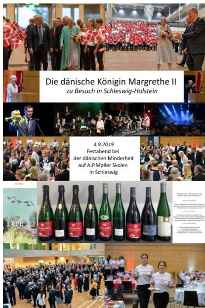
Die dänische Königin Margrethe II zu Besuch in Schleswig-Holstein